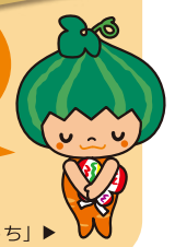
天白区マスコットキャラクター「かぼっち」▶

*寿荘での開会式、八事イオンでは、 天白区の仲間たちの歌や演奏の パフォーマンスがあります。 お楽しみください！ *天白区内の福祉施設の自主製品を販売する、 マーガレットマルシェも同時開催♪ ぜひご覧ください！