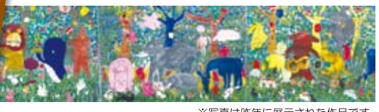
※写真は昨年に表示された作品です。